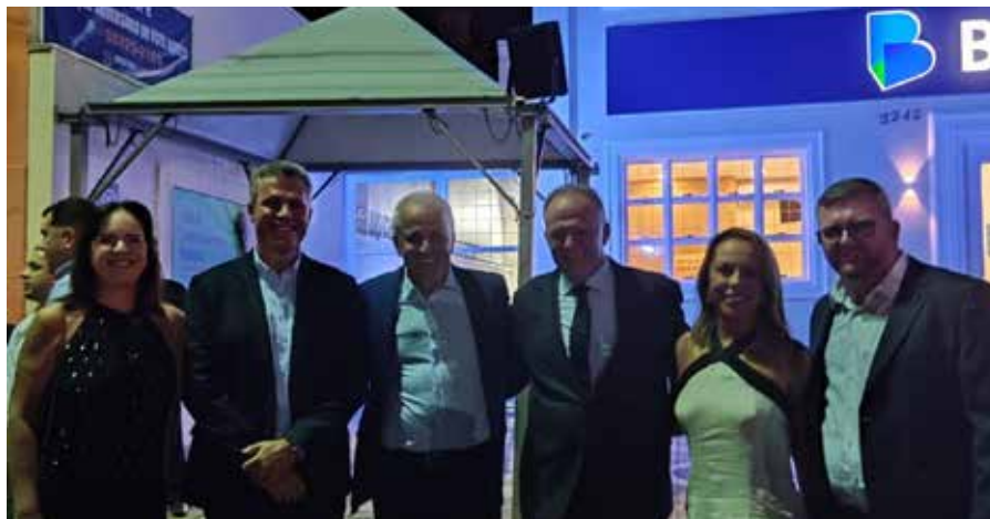
Na foto, o governador do estado do ES, Renato Casagrande, ladeado pelo presidente da Banestes Seguros e Diretores da Seguradora.

O Bizi estará disponível para Android e iOS, permitindo que os servidores de órgãos conveniados simulem e contratem o crédito consignado de forma ágil e segura. O aplicativo também oferecerá a captura de biometria facial para garantir a segurança dos usuários.