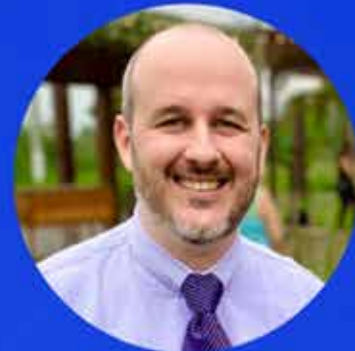
Igor Balbino Cloudseg by Mediabrasil

Descubra as vantagens de ter presença online e conheça a nova Plataforma Cloudseg, uma solução em parceria com o Sincor-ES e CVG-ES para as Corretoras terem um Site na Internet.